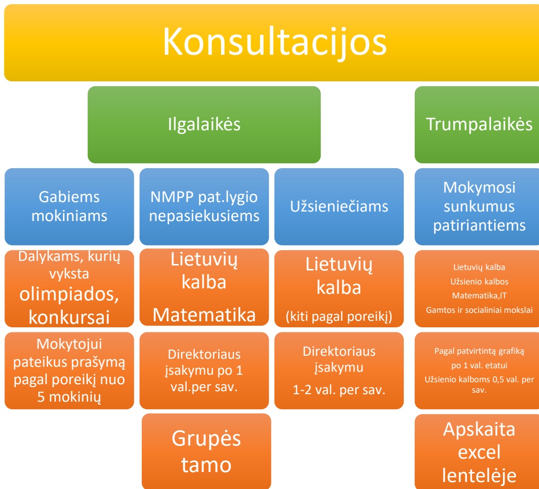
2 pav. Konsultacijų organizavimo schema.

38. Mokinio individualus ugdymo planas kuriame numatoma, kaip mokymosi turinys pritaikomas mokiniui pagal jo mokymosi galias ir mokymosi poreikius, rengimas pagal Progimnazijos VGK suderintą plano formą ir turinio struktūrą. Individualus ugdymosi planas sudaromas mokiniui: